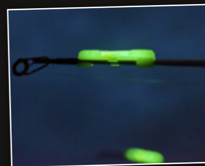
Een (breek)lichtje in de top is handig om aanbeten te zien.

krijgen, dan zijn ze op hun stevigst en kunnen er verre worpen mee gemaakt worden. Ingevroren aas is zacht en gooi je snel van de haak af. Zeepieren en zagers rijt je met een aasnaald op de haak, fluitje van een cent en stevig genoeg om te werpen. Een makreelstrip prik je gewoon op de haak. Twee keer doorsteken en je bent gegarandeerd dat deze zonder problemen op de bodem aan komt. Met mesheften is dat een iets ander verhaal. Hiervan gebruik je enkel het stevige gedeelte. Rijg het op de aasnaald en wikkel deze goed met bindelastiek in. Nu kun je hem zo op de haak rijgen. Een combinatie van bovengenoemde aassoorten is heel