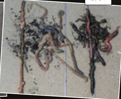
Op die haken rijg ik pieren en/of zagers met een aasnaald.

goed mogelijk, dus experimenteer er maar op los.