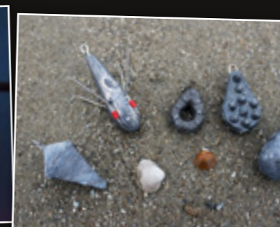
Lood voor elke situatie.