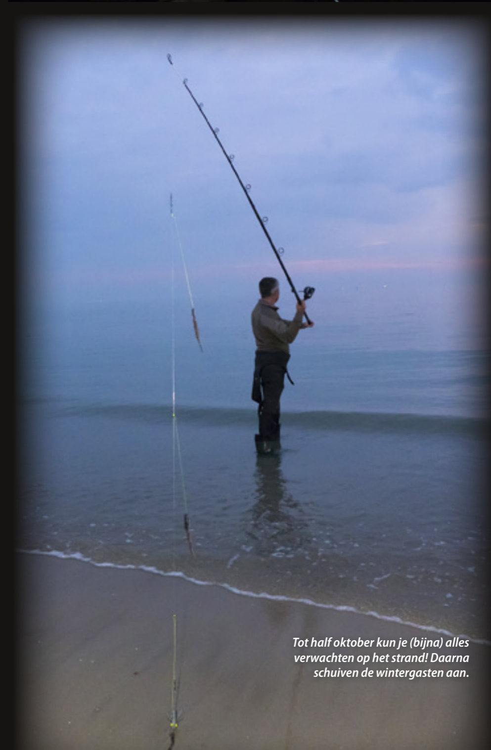
Tot half oktober kun je (bijna) alles verwachten op het strand! Daarna schuiven de wintergasten aan.

T ot half oktober mag je als strandvisser nog van alles verwachten: bot, tong, zeebaars, wijting, wat scharren of een mooie gladde haai, het kan allemaal. Daarna neemt toch echt de wintervis de overhand. Onder deze wintervissen vallen wat platvissoorten, zoals schar en bot, maar vooral op wijting kan er nu goed gevestigd worden. Wijting is een kabeljauwachtige, hij wordt vaak verward met een jonge kabeljauw. Het grote verschil is dat een volwassen wijting geen kindraad heeft, een kabeljauw heeft dat altijd. Wijtingen hebben drie rugvinnen en een overduidelijke zwarte zijlijn. Zijn bek zit vol met kleine puntige tandjes om een prooi te grijpen en vast te houden. Hij jaagt voornamelijk op garnalen en kleine vis, maar een zager of zeeper zal hij zeker niet links laten liggen. Ze komen en gaan dan ook met de garnalentrek. Het zijn echte scholenvissen, vis je op de juiste plek en willen ze azen, dan heb je er zo een stel bij elkaar gevangen.