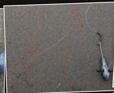
Drie wapperlijnen met relatief forse haken.