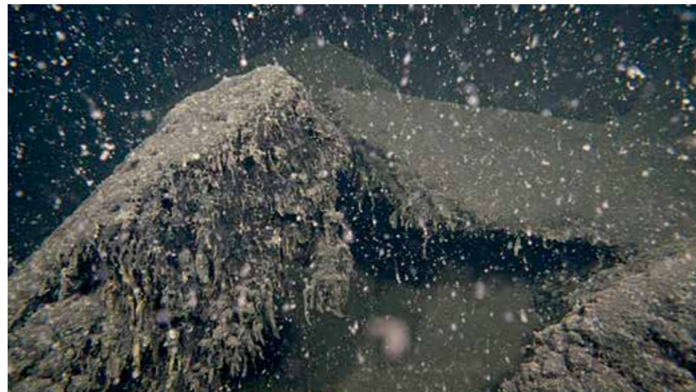
Levenloze bodem van het Grevelingenmeer op 18 meter diepte (juli 2013).

name de kosten daarvan, blijft een heikel punt. Inmiddels wordt er al jaren gepraat over de problemen met de waterkwaliteit in het meer, maar lijkt een definitieve oplossing verder weg dan ooit.