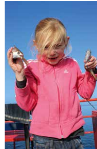
Het Grevelingenmeer is een ideaal water om kids te laten kennismaken met de zoute visserij.