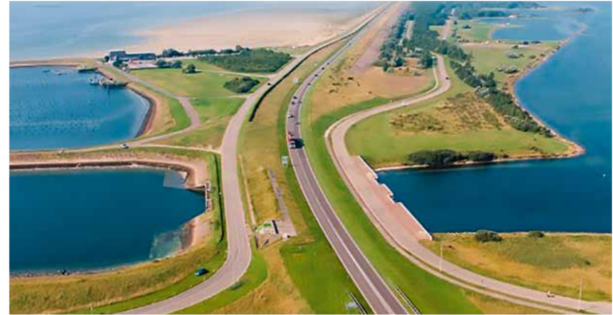
Via de Flakkeese spuisluis in de Grevelingendam kan nu vers, zuurstofrijk water vanuit de Oosterschelde worden ingelaten.

Moeten we als sportvisser dan maar de handdoek in de ring gooien voor wat betreft het potentieel zo bijzondere Grevelingenmeer? Zeker niet! Ook al zijn de vangsten dan niet meer zoals voorheen, er valt echt nog wel een visje te vangen. Zeker wie in de avonden gaat vissen kan nog eens tegen een leuke vangst aanlopen. Vooral in de schemering en het donker heb je kans op een mooi portie wijting. De diverse charterboten maken (bij voldoende belangstelling) avondvaarten en vooral de jeugd vindt het nogal spannend om in het donker achter de zeevissen aan te gaan natuurlijk.