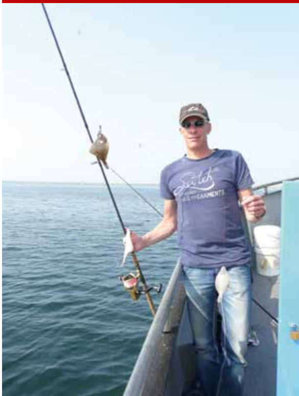
's Winters wordt er met name wijting gevangen, maar je kunt weldegelijk nog steeds ook een platvisje vangen.