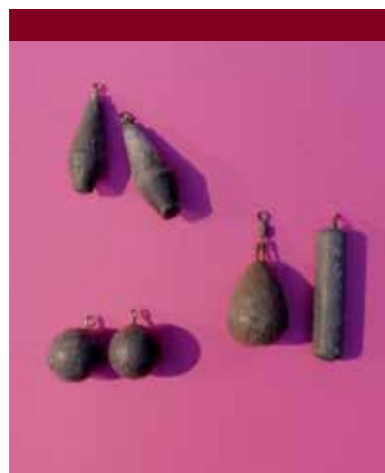
Lood zonder ankers en niet zwaarder dan een grammetje of 50 en fijne haakjes!