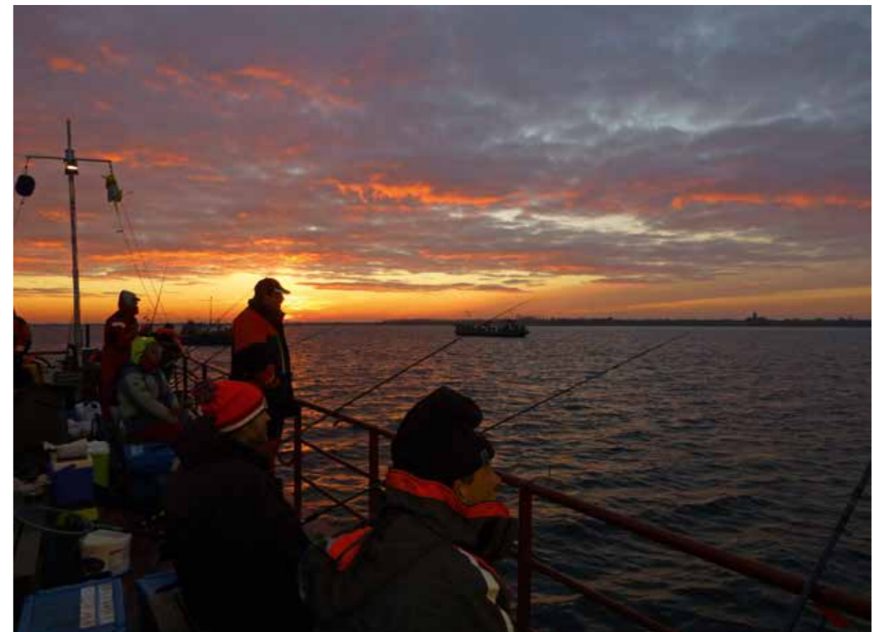
Vooral in de schemering en het donker heb je kans op een mooi portie wijting.