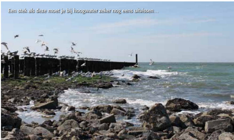
Een stek als deze moet je bij hoogwater zeker nog eens uitvissen...