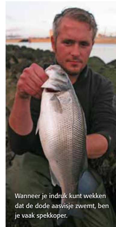
Wanneer je indruk kunt wekken dat de dode aasvisje zwemt, ben je vaak spekkoper.

Vissen tegen de palen is een hele kunst. Kunstaasvissers werpen er zo dicht mogelijk tegen, want daar foerageert de zeebaars... Dobbervissers hebben hier een probleem. Binnen