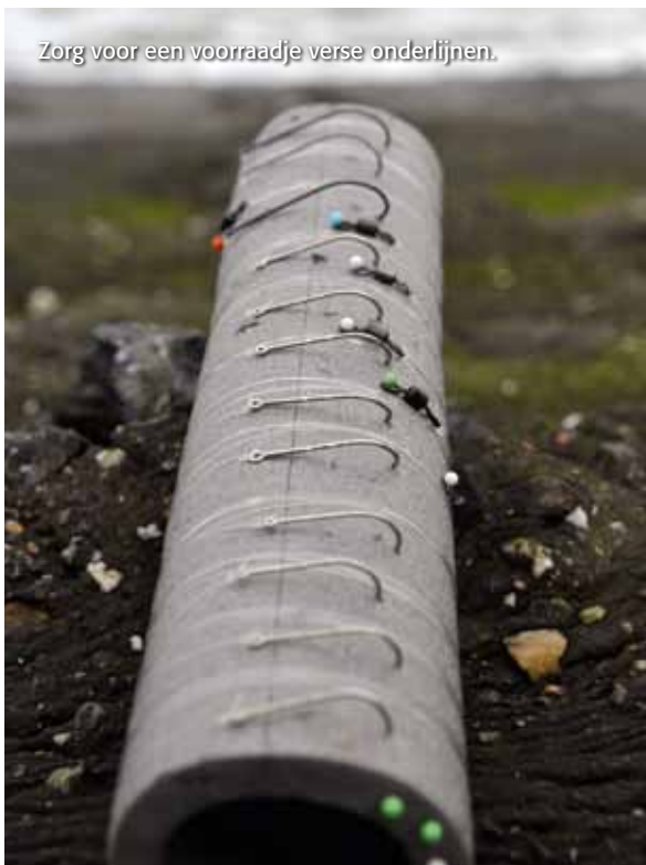
Zorg voor een voorraadje verse onderlijnen.

Grote steekzagers genieten de voorkeur boven de kweekvariant. Blijven de aanbeten uit, wissel dan van aas; een reepje inktvis uit de vriezer kan bijvoorbeeld wonderen verrichten! Voordeel hiervan is dat het altijd voorhanden en gemakkelijk te bewaren is. Wie aan zachte krab kan komen