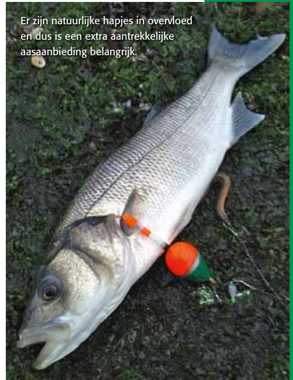
Er zijn natuurlijke hapjes in overvloed en dus is een extra aantrekkelijke aasaanbieding belangrijk.

Zorg dat je verschillende aassoorten bij je hebt; zeebaarzen zijn nogal kieskeurig. Zagers zijn gemakkelijk verkrijgbaar en vaak een goed aas.