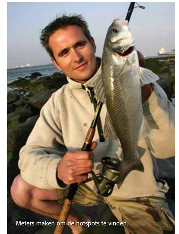
Meters maken om de hotspots te vinden.

Palen en steentort dienen als fundament voor diverse schelpdieren. Stuk voor stuk voorzien van ongelofelijk scherpe randen die als een scheermes door je lijn snijden. Eén moment onoplettendheid en het hele zaakje ben je kwijt. Om goed uit de voeten te kunnen, heb je daarom een lange hengel nodig. Zelf vis ik met een hengsel voor de karper. Met zijn 390 cm ben ik in staat om over de stenen heen te vissen, zodat tijdens de dril al het werk achter de blokken wordt uitgevoerd. Met zijn 1¼ lb lijkt hij een beetje licht voor dit werk, maar