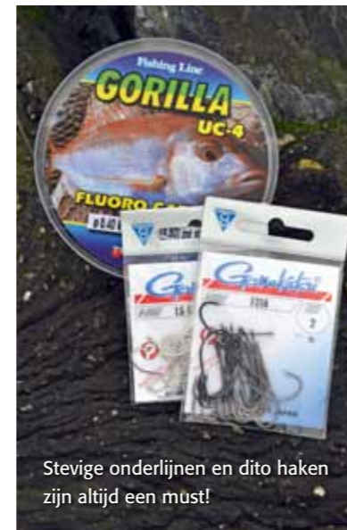
Stevige onderlijnen en dito haken zijn altijd een must!