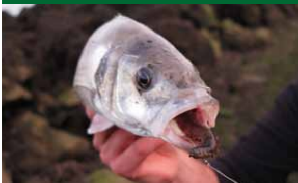
Grote kweek- of steekzagers zijn een prima keuze voor de vaak kieskeurige zeebaars.

of zelf de moeite neemt deze te gaan zoeken, heeft daarmee hét ultieme topaas voorhanden! Zo'n 'peeler' laat geen enkele baars aan zijn of haar neus voorbij gaan; Labrax is er dol op.