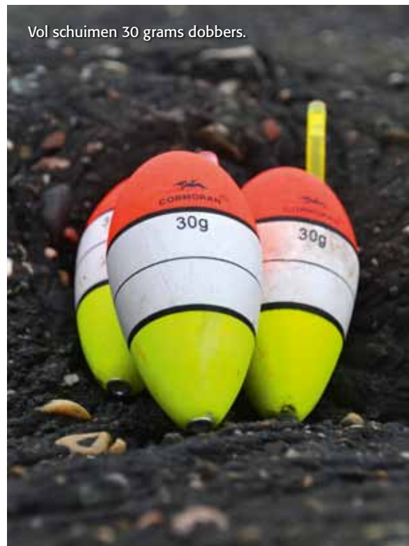
Vol schuimen 30 grams dobbers.