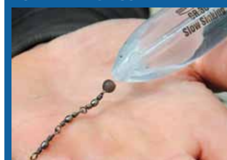
De bombetta komt direct op de nylon of gevlochten hoofdlijn. Daaronder komt een kraaltje en een (trio)wartel.