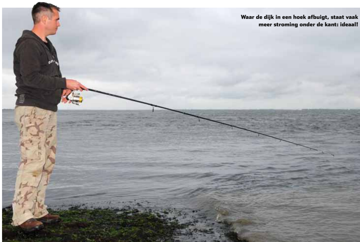
Waar de dijk in een hoek afbuigt, staat vaak meer stroming onder de kant: ideaal!

staat. Van wind is de makreel absoluut niet bang, met windkracht 4 op de kant jagen ze nog volop. Mooie bijkomstigheid is dat zich onder zulke omstandigheden ook nog veel eens een mooie zeebaars vergist in je aas.