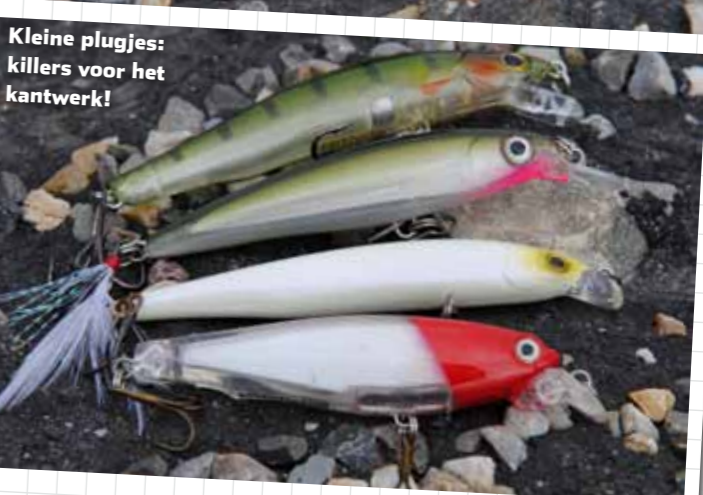
Kleine plugges: killers voor het kantwerk!

D e makreel verschijnt meestal in mei onder onze kust, om pas ergens eind september weer te vertrekken. Deze zomergast kom je langs vrijwel de hele kust tegen. Op Texel, de koppen van Den Helder, pieren van IJmuiden, alle noord- en Zuid-Hollandse stranden, de Zeeuwse kust en Ooster- en Westerschelde; ze zijn werkelijk overal te vangen. Concentreer je daarbij op de hotspots ter plekke. Dit zijn in de regel plekken aan ‘open zee’ met vrij diep water binnen werpbereik – diepe havens uitgezonderd.