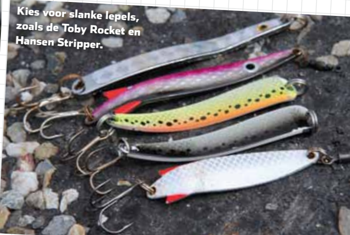
Kies voor slanke lepels, zoals de Toby Rocket en Hansen Stripper.