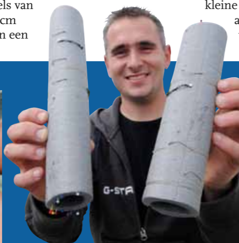
Onder de wartel komt de onderlijn. Neem altijd reserve exemplaren mee, dit voorkomt tijdverlies aan de waterkant.