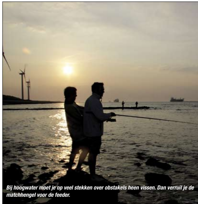
Bij hoogwater moet je op veel stekken over obstakels heen vissen. Dan verruil je de matchhengel voor de feeder.

Het is verleidelijk om tussen de dobber en hoofdlijn ook een aantal meters fluorocarbon voorslag te plaatsen tegen doorschuren, maar daar zit een groot nadeel aan. Fluorocarbon is namelijk zwaarder