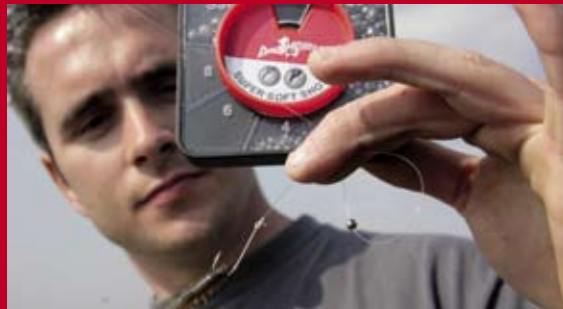
Soms moet je de vis wat dieper zoeken, vooral als je het op makreel voorzien hebt. Zet dan één of twee loodhagels nr. 4 boven de haak.