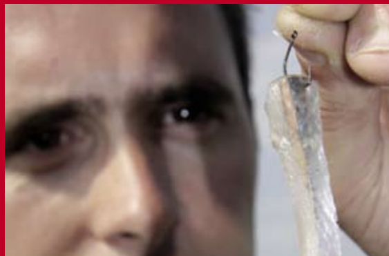
Voor geep en makreel is een reepje vis – inderdaad van geep of makreel – onweerstaanbaar. Voor zeebaars neem je een levendige zager.