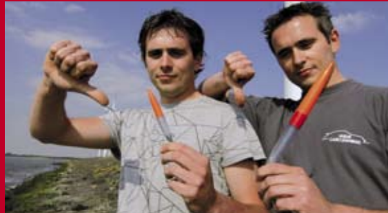
Dit soort knoeperts van geepdobbers zijn zó 1980. Weg ermee en sla snel een voorraad controllers of compacte matchdobbers in.