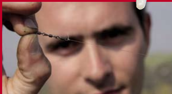
Bij harde stroming wil de onderlijn nog wel eens gaan kringelen. Om dit te voorkomen zet je een driedubbele wartel tussen hoofd- en onderlijn.