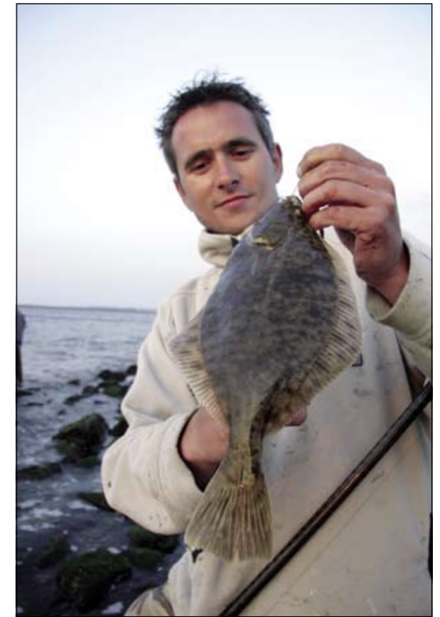
Bij afgaand water sleept de onderlijn op ondiepe zandplaten over de bodem waardoor je goed bot kunt vangen. Zeker geen straf natuurlijk!

De fotograaf wandelt na de 'rust' als eerste het water in en schrikt zich te pletter als een dikke vis voor zijn voeten wegschiet. Oké dan, ze zitten er weer hoor. De dobber maakt flinke driften van wel een meter of dertig. De derde drift is het raak. Een massieve vis van zeker 60 centimeter rost door de slip en kiest het ruime sop. Zeebaars on the rocks! Het leek al te mooi om waar te zijn en vlak voor de landing weet deze vis zich van de haak te ontdoen. Domme pech, zenuwen, ik weet het niet, maar ik baal als een stekker. Snel knoop ik een