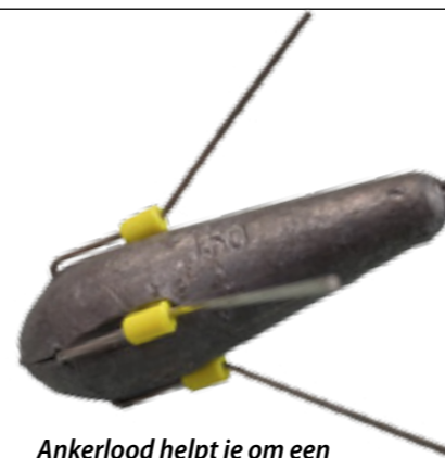
Ankerlood helpt je om een mooie bocht in je lijn te krijgen, zodat de onderlijnen op de bodem liggen.

Goed, voor deze haaien zul je geen strand vol mensen in paniek zien vluchten, maar gaaf en sterk zijn ze absoluut!