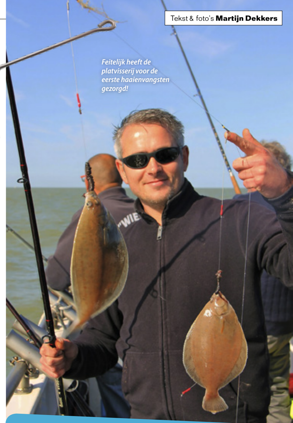
Feitelijk heeft de platvisserij voor de eerste haaienvangsten gezorgd!

De onderlijn is erg belangrijk, mijn favoriet is een paternoster van ongeveer 150 cm voorzien van drie stalen afhouders. Wel moeten er bij iedere afhouder een of meerdere loodjes geplaatst worden zodat het geheel zo plat mogelijk op de bodem blijft liggen. Aas dat niet op de bodem ligt wordt genegeerd. De haaklijntjes mogen niet langer zijn dan de afhouder, omdat de